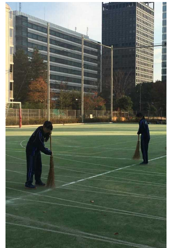
↑率先して会場の片付け をする姿はさすが!