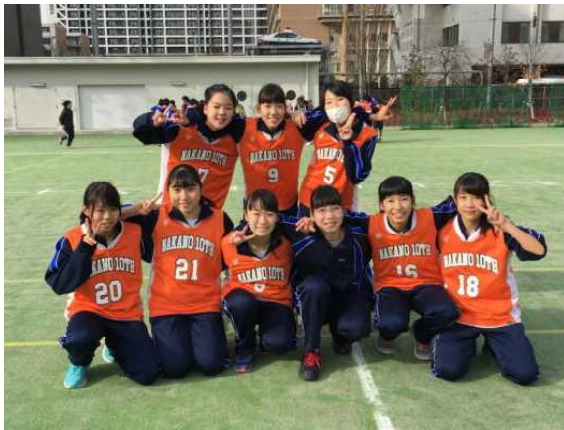
↑優勝チームに勝利するも 得失点差で予選リーグ敗退...