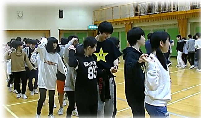
夜は男女仲良くフォークダンス♪