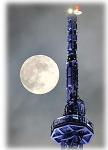
福岡で観測されたスーパームーン