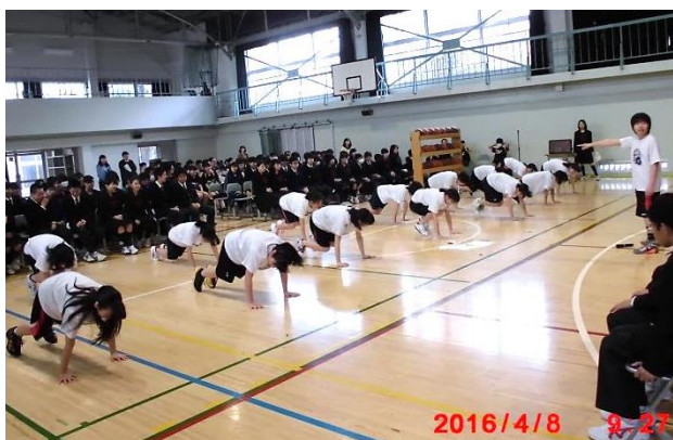
対面式での部活動紹介の様子