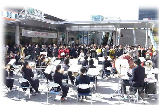
<演奏に聞き入る大勢の観衆>

演奏後、十中第一期生というお方から、「十中の演奏が一番良かったです」とお褒めの言葉をいただきました。