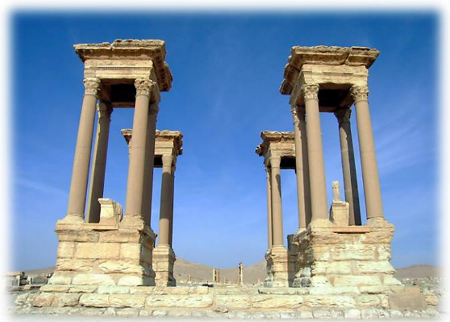
<パルミラ遺跡(ウィキペディアより)>

カレンダーには「パルミラの遺跡」「シリア北部の家畜市場」「アフガニスタンの遊牧民」等の絵画が掲載されているが、それらの地域は現在、ISの支配下にあたり、内戦激化で硝煙が止まなかったり、世界の火薬庫と化している地域だ。シルクロード一帯の平和を願っていた画伯が存命であれば、さぞかし心を痛めることだろう。